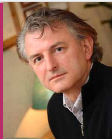
PREMA RIJEČIMA ginekologa Ivana Fističića, spolna želja nakon poroda je umanjena zbog emocionalne nestabilnosti (gore)

"U VRIJEME NAKON POROĐAJA majka je zaokupljena negom novorođenčeta i redovitim dojenjem. Dojenje stimulira dobru produkciju mlijeka kroz visoke vrijednosti hormona prolaktina koji pak blokira funkciju jajnika. Rijetke su ovulacije i žena koja doji u pravilu ne krvari. Uz to, nakon porođaja se naglo smanjuje koncentracija estrogena te žena proživljava nekoliko mjeseci stanje koje nalikuje na postmenopausalno s blagim simptomima, a jedan od njih je suhoća rodnice. Kako odnos ne bi bio neugodan i bolan, ovdje pomaže lokalna lubrikacija ili nanošenje niske doze estrogenske kreme, što može biti i dio spolne igre kojom se postiže bolje vlaženje rodnice i smanjuje nelagoda", kaže zagrebački ginekolog prim. dr. sc. Ivan Fističić.