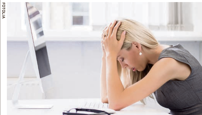
Loše životne navike rizik su za preuranjenu menopauzu